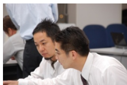
プロがマンツーマンでサポート

対象：経営者の方 場所：(株)アテイン 研修室 予定日：5/9(木)・6/13(木)・7/11(木) 8/8(木)9/12(木)・10/9(水) 11/14(木)・12/12(木) 時間：10：00～18：30(1日コース) 会費：54,000円(2人まで)