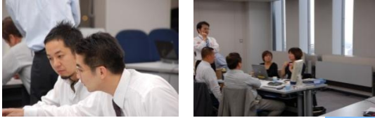
プロがマンツーマンでサポート